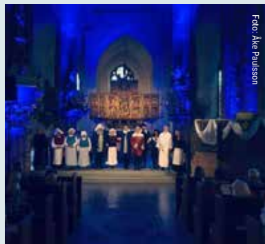
Västerås domkyrkas dramagrupp