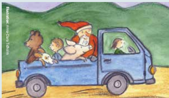
Illustration: Anna-Clara Tidholm