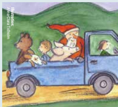
Illustration: Anna-Clara Tidholm