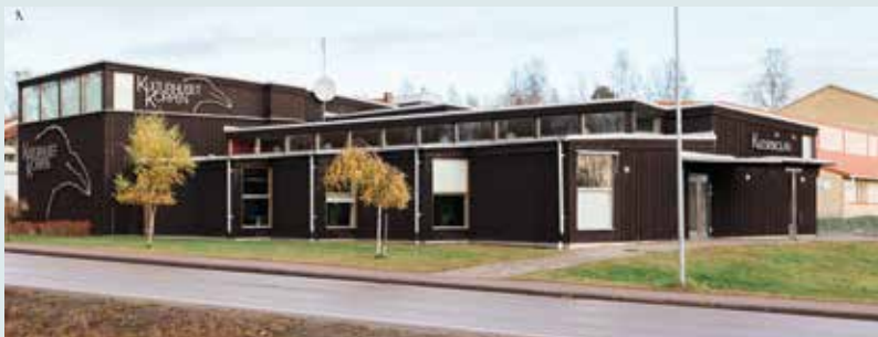
RAT – Ridderhyttans Arbetarteater och Kulturskolan