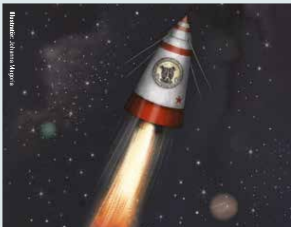
Illustratör: Johanna Magoria

Hemsida: riksteatern.se/sala , teatervarvind.se