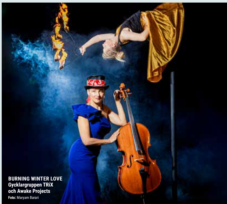
BURNING WINTER LOVE Gycklargruppen TRiX och Awake Projects

Vallby Sommarnöje är ett produktionsbolag med rötterna i Västerås och som har ambitionen att starta en ny sommartradition på den anrika folkparksteatern som ligger inne på Vallby Friluftsmuseum. Under många år framöver kommer publiken att erbjudas högklassig underhållning i form av revyer, farsor, lustspel, musikaler med mera och varje sommar ska minst en ny produktion ha premiär. Läs mer på vallbysommarnoje.se