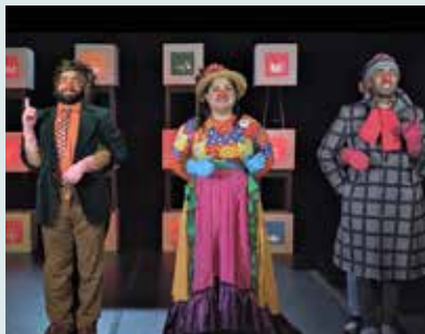
Acting for change